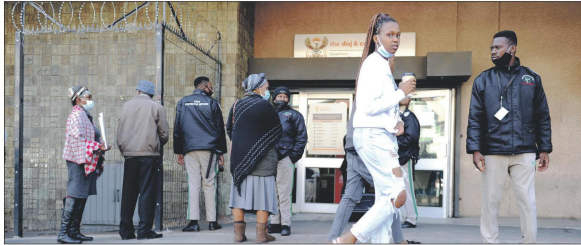
Lang toue mense buite die kantoor van die meester in Pretoria is 'n alledaagse gesig, met net 'n breukdeel van die toonbanke wat beman word.

huus waar daar nie genoeg beddens vir almal is nie. Die ma raap en skraap met 'n staatsoelaag van R470, onderhoud van R500 van Anle se pa en die geldjies wat inkom wanneer sy mense in die omgewing se kleure was of nou en dan plaaswerk kry.